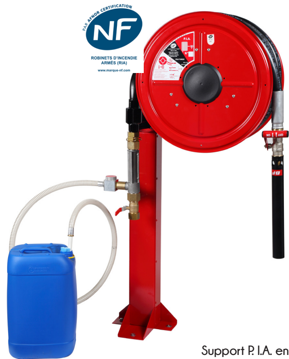
Support P. I.A. en option